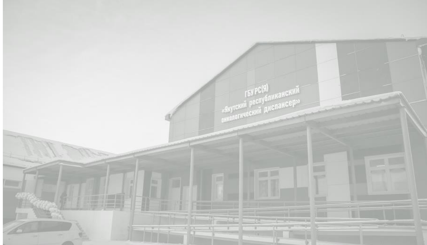
ГБУ РС(Я) "Якутский республиканский онкологический диспансер"